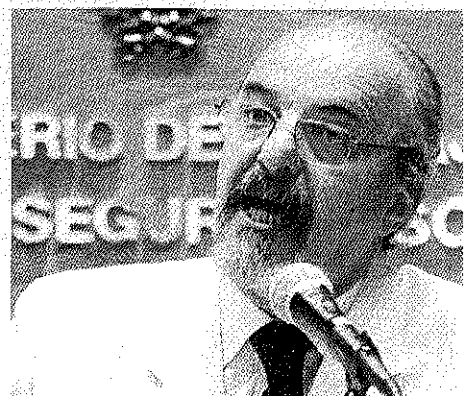
Los ministros Giorgi y Tomada tuvieron una reunión con los empresarios del sector de máquinas y herramientas.